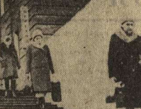
Подземный переход возле Управления Ю-8, ж. д.