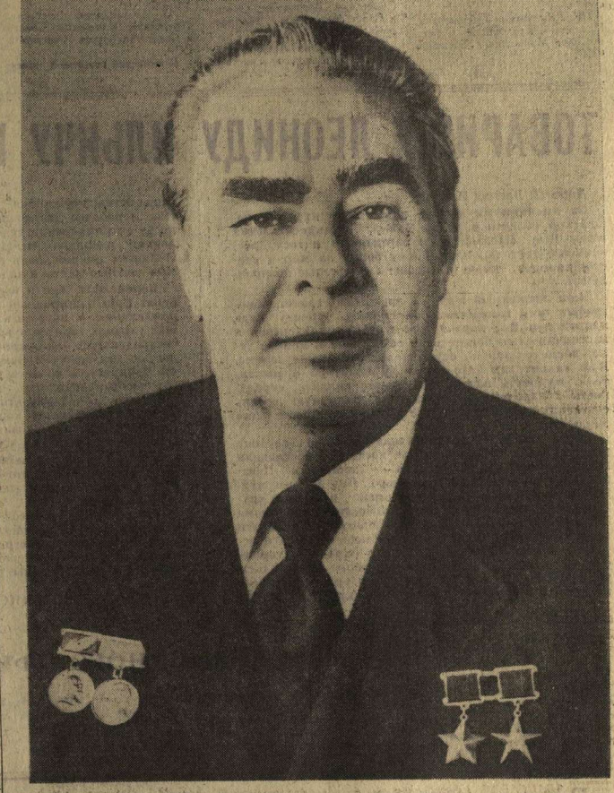
ГЕНЕРАЛЬНЫЙ СЕКРЕТАРЬ ЦК КПСС ТОВАРИЩ Л. И. БРЕЖНЕВ

Чилийские власти, незаконно продолжавшие Л. Корвалана в тюрьмах и концлагерях более трех лет, вынуждены были под давлением мирового общественного мнения освободить его и депортировать за пределы Чили. Коммунистическая партия Советского Союза, Советское правительство предложили возможность тов. Л. Корвалану прибыть в СССР и оказать ему полное гостеприимство. Советские коммунисты, все советские люди горячо поздрав-