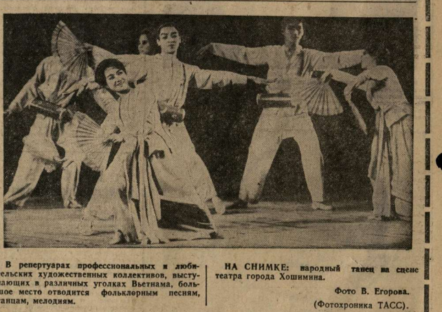
В репертуарах профессиональных и любительских художественных коллективов, выступавших в различных уголках Вьетнама.

БОНН. Превращение Германской коммунистической партии в политическую партию, в которой призывают всех немецких коммунистов.