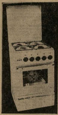
Коллектив нашего завода одним из первых в стране освоил производство газовых плит. В настоящее время мы выпускаем плиты трех модификаций. Изделия завода демонстрировались на ВДХХ

В. ОЛЕИНИЧЕНКО, начальник бюро товаров народного потребления Воронежского авиазавода.