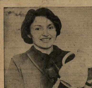
В эти дни в Москве на ВДХХ развернута выставка народных художественных промыслов. Широко здесь представлена продукция Воронежского завода керамических изделий.