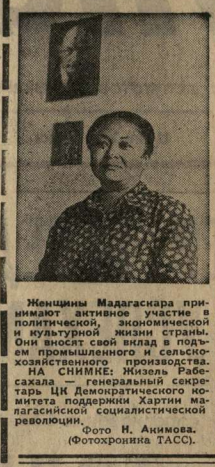
Женщина Мадагаскара принимает участие в культурной жизни страны.

В странах социализма САНАТОРИЙ «МАРИНА» Люди давно заметили целебные свойства источников близ поселка Ковачево в Средней Словакии.