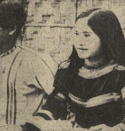
Б. АЛЕКСЕЕВ, соб. корр. АПН.

КАРАКАС (ТАСС). — Орган Коммунистической партии «Трибуна популяр» от имени венесуэльских коммунистов выступила с требованием пресечь похищение деятельности в стране агентов Центрального разведывательного управления США. Газета приводит пространный список лиц, которые по заданию ЦРУ действуют в Венесуэле с целью дестабилизации существующего режима, побороть протестные движения, проводить по указке из Вашингтона антисоветскую кампанию. Для того, чтобы противостоять империалистическому заговору, указывает «Трибуна популяр», необходимо захватить власть в стране агентов ЦРУ.