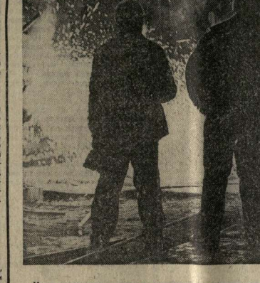
Идет очередная планка в электростанционном цехе ордена Ленина Новолипецкого металлургического завода.