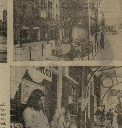
На СНИМКАХ: сверху слева — в бухте Сиднея. Вверху справа — памятник жертвам войны на Мартин-плаза. Внизу — на борже труда.