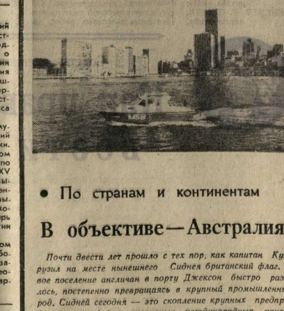
По странам и континентам В объективе — Австралия. Почти шесть лет прошло с тех пор, как капитан Кук водрузил на месте нынешнего Сиднея британский флаг. Первое поселение англичан в порту Джексона быстро разрасталось, постепенно превращаясь в крупный промышленный город. Сидней сегодня — это скопление крупных предприятий, банков, контор многонациональных монополий, хозяйничающих в стране. Сидней по праву называют зеркалом современной Австралии. В нем отражается бесчисленное множество проблем, стоящих перед страной, в числе которых — инфляция и беспрецедентный рост цен, увеличение армии безработных и диктат иностранных корпораций, получающих в Австралии баснословные прибыли.