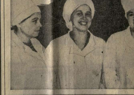
— труженникам колхоза имени Фрунзе.