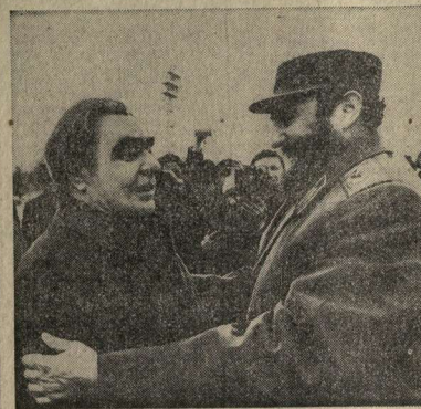
В Москву прибыл с неофициальным дружеским визитом Первый секретарь ЦК Компартии Кубы, Председатель Государственного Совета и Совета Министров Республики Куба Фидель Кастро Рус.

НА СНИМКЕ: во время встречи в аэропорту.