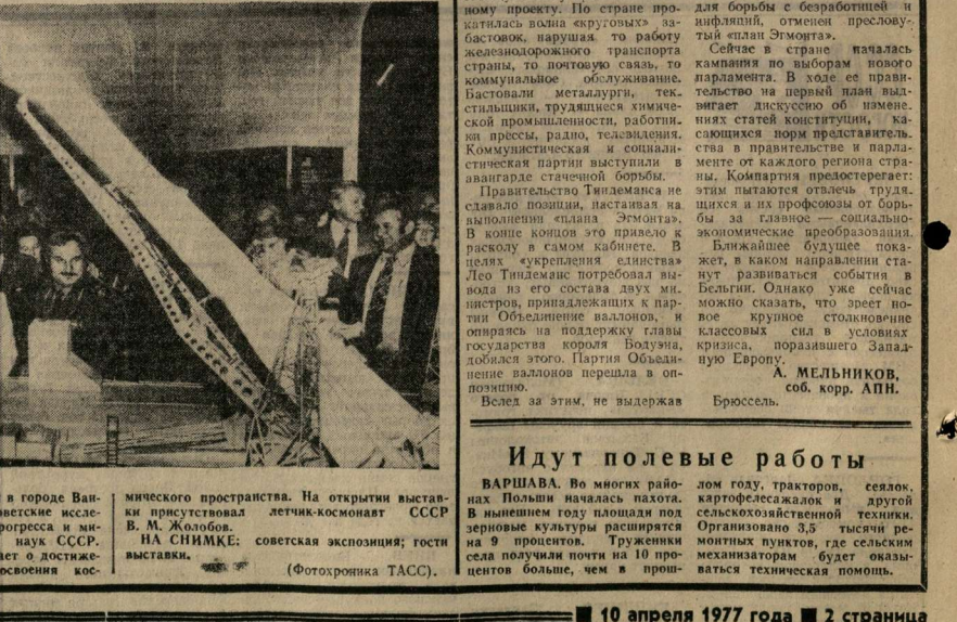
КАНАДА. С большим успехом в городе Ванкувер проходит выставка «Советские исследования космоса в интересах прогресса и мира». Организаторами Академии наук СССР. Экспозиция подробно рассказывает о достижениях Советского Союза в деле освоения кос-