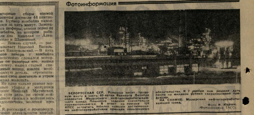
БЕЛОРУССКАЯ ССР. Успешно несут трудовую вахту в честь 60-летия Великого Октября коллективы Мозырского нефтеперерабатывающего завода. Плановые задания значительно выполняются. В ответ на призыв ЦК КПСС встретить юбилей новыми достижениями нефтепереработки приняты повышенные обязательства. К 7 ноября они решили дать почти миллион буферов сверхпланового производства. СНИМКИ: Мозырский нефтеперерабатывающий завод.

До войны шапошниковцы могли только мечтать о ступенчатом урожае. Спустя несколько лет после победного 45-го они начали собирать по сто и более пудов с гектара. А теперь вот урожайность ранних зерновых составила 29,7 центнера с гектара. 185 пудов! А на одном участке