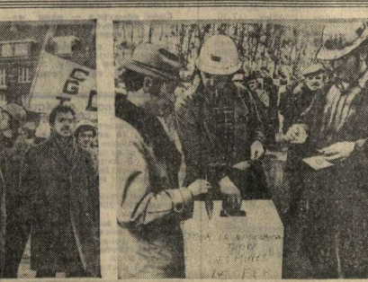
увольнении 7 тысяч рабочих заводов на севере страны в Лотарингии. Борьба за свои жизненные права, французские металлурги выступили с требованием немедленно прекратить производство в Лотарингии. На СНИМКАХ: слева — рабочие предприятия «Юзиор» в рядах демонстрантов, требующих национализацию производств; справа — горняки Лотарингии голосуют за национализацию горнодобывающей промышленности. (Фотохроника ТАСС.)

ДЕЯТЕЛИЯ концерн, занимающийся только о росте своих прибылей, наносит ущерб национальным интересам Франции, порождает безработицу. Тревожное положение сложилось, в частности, в горнодобывающей промышленности страны. Под предлогом кризиса и реорганизации производств французские монополии пригласили к массовым увольнениям. Так, металлургический трест «Юзиор» объявил о предстоящем