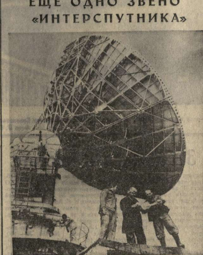
Близ Софии при технической помощи Советского Союза сооружается наземная станция космической связи. Служа в эксплуатации этого крупного объекта дальней связи даст возможность Народной Республике Болгарии включиться в международную систему связи «Интерспутник» и позволит ей обмениваться со странами — участниками этой международной программой, наладить с ними устойчивую многоканальную телефонную и телеграфную связь. НА СНИМКЕ: 56-тонная антенна строящейся наземной станции космической связи.

Вместе с советскими народами народы других социалистических государств 60-го годов Великой Октябрьской социалистической революции все вместе достигли великих успехов. Прозданный миром, Праздником всей планеты называют большие Октябрьские юбилейные торжества, общественные организации. ПРАГА. Великая Октябрьская социалистическая революция привнесла в мир свет, прогресс, социализм и прогресс. Это — величайшее международное сотрудничество и интернациональная солидарность. Это — величайшее сотрудничество и интернациональная солидарность. Это — величайшее сотрудничество и интернациональная солидарность. СОФИЯ. Члены Болгарского земледельческого народного фронта и Болгарского коммунистического центра в честь 60-летия Октябрьской революции в Болгарии организовали грандиозную программу мероприятий, посвященную 60-летию Октябрьской революции.