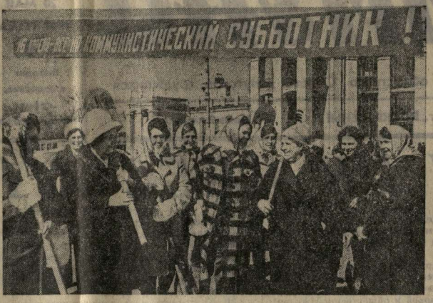
НА СНИМКЕ: группа рабочих Воронежского отделения дороги и завода на благоустройстве придорожной площадки. После субботника большинство из них приступит к своим служебным обязанностям, обеспечат продвижение пассажиров в грузовом поезде.

Оживление в Камском районе — одна из основных отраслей животноводства. Планомно ведется племенная работа, отбираются особи мясошерстного направления, улучшаются условия содержания животных, применяются полные рационы их кормления. Примером успешного развития может служить колхоз «XX партсъезд». Здесь заканчивается окот овец. От 907 овецоток было получено к прошлому послеполдню 480 ягнят, для 98 на каждую овцу. Много сделано в хозяйстве для интенсивного развития этой отрасли. Два фермы были объединены в одну крупную. Это позволило сконцентрировать условия чабанов на повышении продуктивности овец. Бригаду возглавляет опытный чабан Владимир Ерикович Рубцов, отмеченный лаврой отличия за достижения в соревновании овецотодов района. Первым помощником у него старший бригадир Николай Васильевич Крижен. Вместе с ними ухаживают за овцами. Вера чабаны дежурят на ферме. Расставляя шты для разгараживания помельней, кормят маток и молодняк, принимают еще 12 ягнят, а всего за шесть дней — 72. Это большая радость: наделы оправданы, получено по 100 ягнят на сто овецоток. А. ЗЯБЛОВ, корреспондент газеты Камского района «Светлый путь».