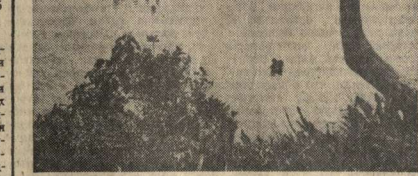
НА СНИМКЕ: Республика Уганда. Озеро Набугубое.

Г. ТАРАКИНИН, работник производственно-технического объединения «Электроника».