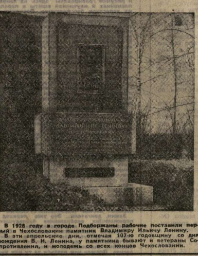
В 1928 году в городе Подборжанами рабочие поставили первый в Чехословакии памятник Владимиру Ильичу Ленину. В эти апрельские дни, отмечающие 107-ю годовщину со дня рождения В. И. Ленина, памятника бываю и ветераны Сопротивления, и молодежь со всех концов Чехословакии.

Строители предприятия «Игтава» Брно приняли повышенное трудовое обязательство к 60-летию Великого Октября. Они обязались на год раньше срока закончить сооружение гидростанции Нове Млыны, внедрить рационализаторские предложения с экономией в 5,5 миллиона крон, снизить расход электроэнергии и топлива на пять процентов и сдать металлургам 14 тысяч тонн металлолома. На стройках «Игтава» будут широко применять методы советских строителей Басова и Злобины.