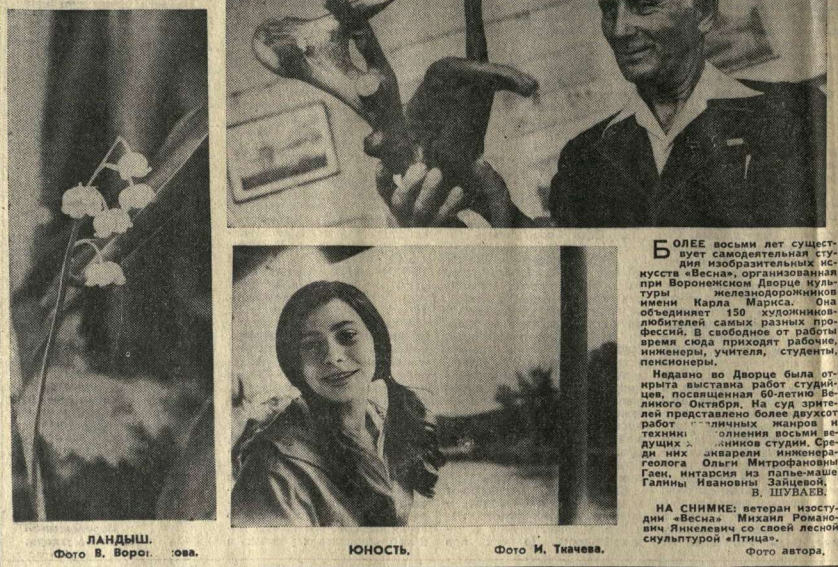
ЛАНДИШ. Фото В. Ворожова. ЮНОСТЬ. Фото И. Ткачев. Фото автора.