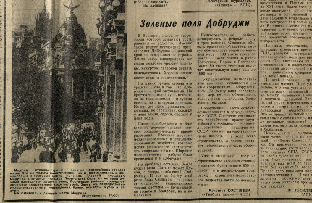
Мадрид — столица страны — один из красивейших городов мира. Это не только политический, но и промышленный, финансовый и торговый центр. Испания, главным плодородным районом считается плаха Пуэрта-Сибис, от которой лучи расходятся десятком улиц. Восточные районы города отличаются современной архитектурой. Здесь же сосредоточены правительственные учреждения, музеи, театры. МА СИНМКЕ: в деловой части Мадрида.