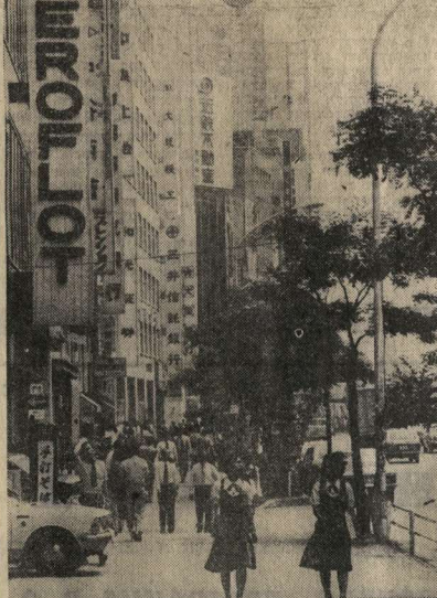
На одной из центральных улиц Токио разместилось представительство Аэрофлота. Десьяты тысяч японцев собрались на советские самолеты, каждый день совершающие полеты по линии Москва—Токио. На снимке: перед входом в представительство Аэрофлота в японской столице. Фотохроника ТАСС.

• Вести из социалистических стран ПРАЖСКИЙ ТЕЛЕВИЗИОННЫЙ В четырнадцатый раз в середине июня в столице социалистической Чехословакии соберется традиционный международный фестиваль «Злата Прага» артисты, режиссеры, операторы, чтецы, работающие в телевидении. Как и в прошлые годы, фестиваль пройдет под девизом: «Телевизионный экран служит делу познания и эмоционального контакта между народами». По традиции здесь будут организованы конкурсы драматических произведений и конкурсы музыкальных произведений и программ с музыкальной тематикой. В нынешнем году в фестивале примет участие 36 телевизионных компаний из 33 стран. Советские фильмы участвовали во всех пражских фестивалях. Дважды они получили гран-при. В 1966 году награды были удостоены фильм «Пакет», а в 1975 году — «Странные взрослые». На XIV съезде телепрограмм СССР создатель ленты «Минувшее» написал режиссер Ю. Лупин и «Октябрь» режиссера В. Мукайлова. А. ДИОРДЕНКО, сб. корр. АПН. Прага.