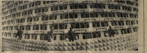
Столица Киргизской ССР Фрунзе — город с полуторамиллионным населением, важный центр культуры и науки республики, один из крупнейших промышленных центров Советского Союза. Из года в год расширяются границы города, растут новые жилые кварталы, реконструируется его центральная часть. На снимке: 208-квартирный жилой дом на Ленинском проспекте города Фрунзе.