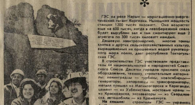
ГЭС на реке Нарын — ирригационно-энергетический гигант Киргизии. Новая станция мощностью 200 тысяч киловатт. Она возведется еще на 600 тысяч, когда в левобережной склоне будут вырублены зал и там смонтируют еще 2 агрегата по 300 тысяч киловатт каждый. Дешевую электроэнергию, многие тонны хлопка и других сельскохозяйственных культур, выращиваемых на орошаемых водой рукотворного моря полях, дает республике Токтогульская ГЭС.

В строительстве ГЭС участвовали представители 44 национальностей и народностей Советского Союза. Десяти городов прислали суда оборудования, технику, строительные материалы: Ленинградцы — турбины, новосибирцы — генераторы, запорщики — трансформаторы, металл пришел из Магнитогорска и Караганды, цемент — из Узбекистана, мостовые краны — из Красноярска, экскаваторы — из Свердловска, автомобили — из Кремленки.