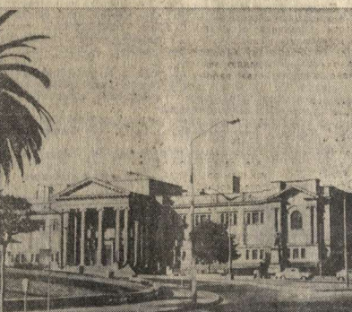
Крупнейший город Австралия — Сидней — является промышленным, финансовым, торговым и культурным центром страны. Сейчас в нем проживает около 2 миллионов человек. На снимке: публичная библиотека.

В этом коллективе выжили комсомольцы, комсомольцы, комсомольцы. Группкомсорг С. Казабона рассказал, например, что их группа ежедневно выполняет задание на 110 процентов, и уверенно набирает темпы, чтобы выполнять свои обязанности в 60-летие Октября.