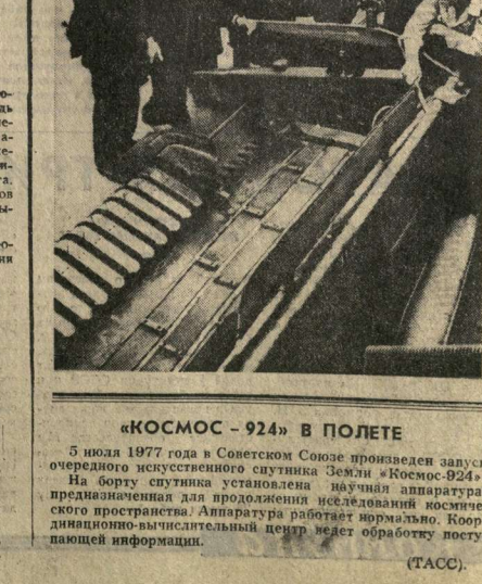
«КОСМОС - 92А» В ПОЛЕТЕ 5 июля 1977 года в Советском Союзе произведен запуск очередного искусственного спутника Земли «Космос-92А». На борту спутника установлена научная аппаратура, предназначенная для продолжения исследований космического пространства. Аппаратура работает нормально. Координационно-вычислительный центр несет обработку поступающей информации. (ТАСС).