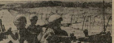
На снимке: на ливано-израильской границе. Израильский патруль готовит новую провокацию.

ЛОНДОН. Механизированные подразделения израильских вооруженных сил перешли вчера южному сектору Голанских высот, углубившись на полкилометра, установили на ливанской территории три постоянных поста. Об этом сообщили из Сайды корреспонденты агентства Рейтер. По его сведениям, подразделения включают пехоту, бронетранспортеры и танки. Одновременно израильские канонерки вошли в территориальные воды Ливана в районе порта Тир на юге страны.