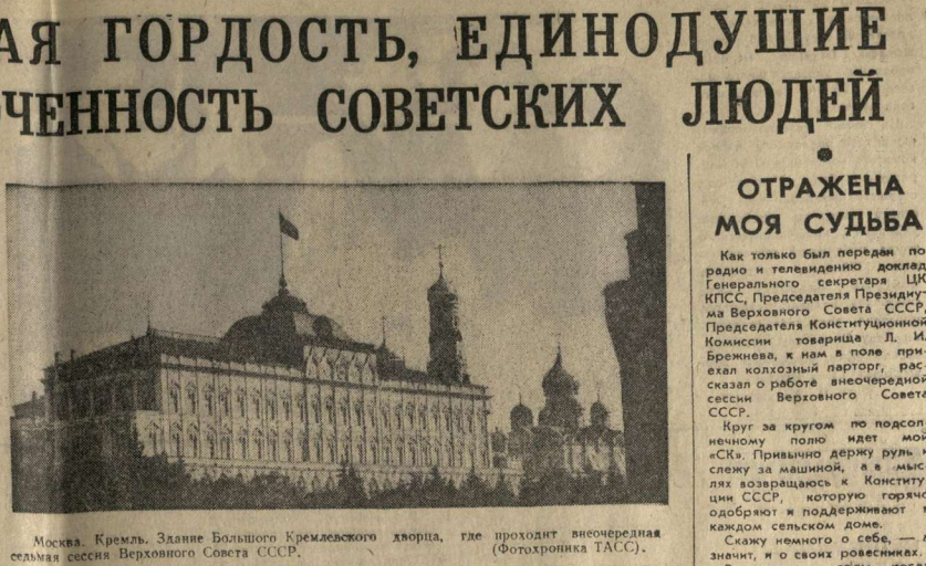
Москва, Кремль. Залание Большого Кремлевского дворца, где проходит внеочередная седьмая сессия Верховного Совета СССР.