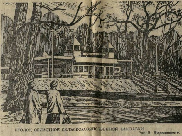
УГОЛОК ОБЛАСТНОЙ СЕЛЬСКОХОЗЯЙСТВЕННОЙ ВЫСТАВКИ. Рис. В. Дорониного.

К Ивану Гавриловичу Шибинову на Юврийском рынке... Иван Гаврилович говорит медленно. Он вообще в разговоре нетороплив, немногословен.