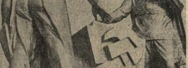
Монумент чехословацко-советской дружбы в городе Простейове.

Учлены делегации посетили Придолье — места славных революционных и боевых традиций, где сражался легендарный конница Буденного. С первых же минут нашего пребывания на воронежской земле железнодорожники и советскому железнодорожному транспорту. Поэтому мы и дальше хотим развивать их трудовые успехи, отличный порядок на рабочих местах и участках. Везде мы встречали искренность, способствующую взаимопониманию и углублению дружбы. Современный вагонный и локомотивный парк, вежливость, добродетельность проводников и пассажиров, поездок, их дисциплинированность были для нас поучительны.