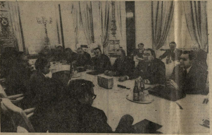
ВО ВРЕМЯ ПЕРЕГОВОРОВ.

21 октября в Кремле состоялся переговорный процесс между Генеральным секретарем ЦК КПСС, Председателем Президиума Верховного Совета СССР Л. И. Брежневым, членом Политбюро ЦК КПСС, Председателем Совета Министров СССР А. Н. Косыгиным, членом Политбюро ЦК КПСС, министром иностранных дел СССР А. А. Громыко и Премьер-министром Индии Морарджи Десаи, министром иностранных дел Индии А. Б. Ваджалом.