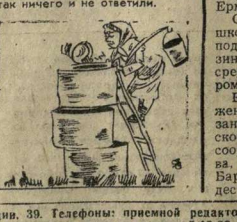
НИЧЕГО НЕ ОТВЕТИЛИ