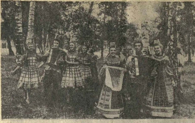
Государственный Воронежский русский народный хор известен далеко за рубежом своими замечательными песнями и танцами, задорными плясками и хороводами.