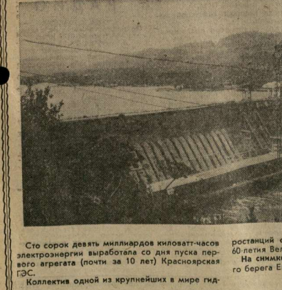
Сто сорок девять миллиардов киловатт-часов электроэнергии выработана со дня пуска первого агрегата (почти за 10 лет) Красноярская ГЭС. Коллектив одной из крупнейших в мире гидростанций соревнуется за достойную встречу 60-летия Великой Октябрьской революции. На снимке: Красноярская ГЭС. Вид с правого берега Енисея.