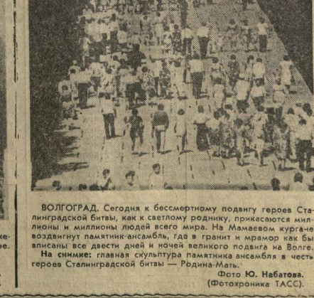
ВОЛГОГРАД. Сегодня к бессмертному подвигу героев Сталинградской битвы, как к светловому роднику, приключаются миллионы и миллионы людей всего мира. На Мамаевом кургане воздвигнут памятник-ансамбль, где в гранит и мрамор как бы вписаны все двести дней и ночей великого поединка на Волге. На снимке: главная скульптура памятника ансамбля в честь героев Сталинградской битвы — Родина-Мать.