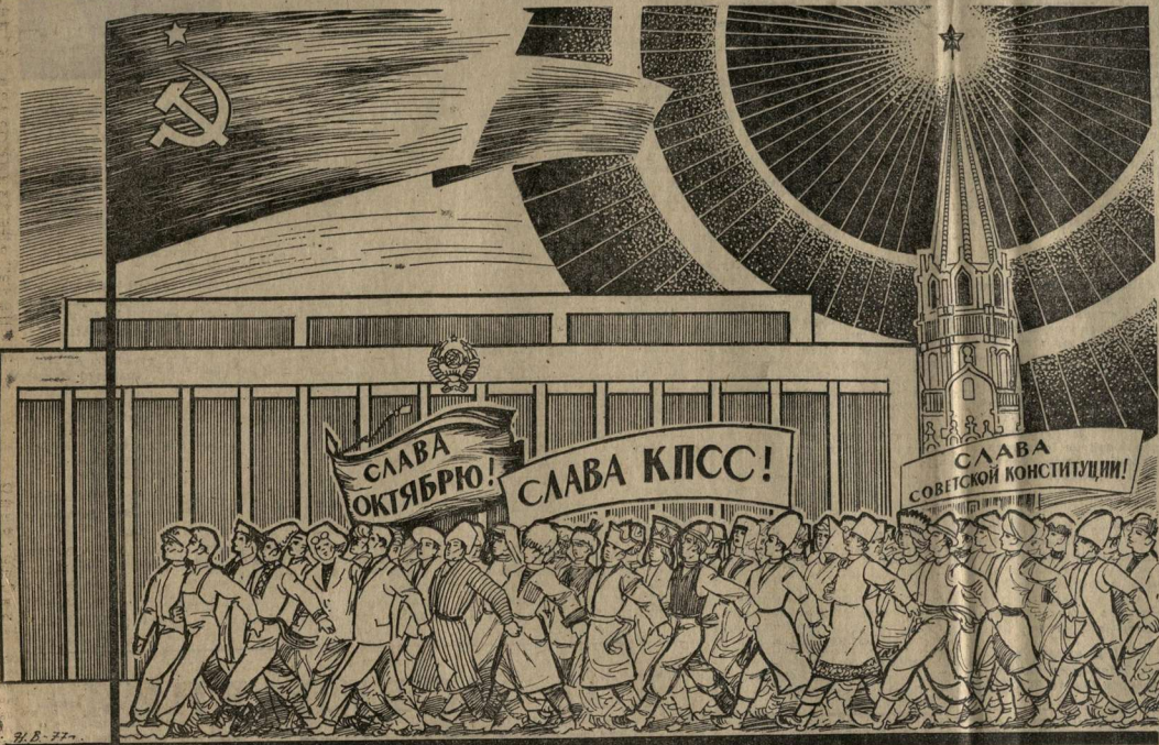
Рис. художника Н. Василенко

ДА ЗДРАВСТВУЕТ НЕРУШИМОЕ ЕДИНСТВО КОММУНИСТИЧЕСКОЙ ПАРТИИ И СОВЕТСКОГО НАРОДА — ИСТОЧНИК ДАЛЬНЕЙШЕГО РАСЦВЕТА СОЦИАЛИСТИЧЕСКОЙ ДЕМОКРАТИИ, ГАРАНТИЯ ПОЛНОГО ТОРЖЕСТВА КОММУНИЗМА! (Из Призывов ЦК КПСС к 60-летию годовщины Великой Октябрьской социалистической революции).