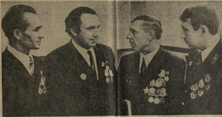
Эти люди и, тихий рассвет, и знойной полдень, и вечернюю дождь встретили только в поле. Они — хлеборобы. Высокие наравы, которые им вручила Родина...