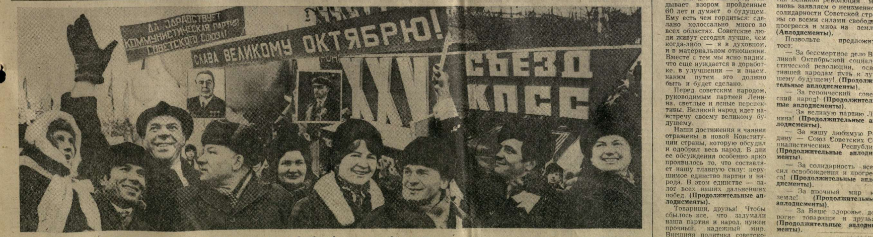
Воронеж. Площадь имени В. И. Ленина. Празднование 60-й годовщины Великой Октябрьской социалистической революции.

За нашу любимую Родину — Союз Советских Социалистических Республик! (Продолжительные аплодисменты.)