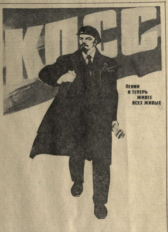
ЛЕНИН И ТЕПЕРЬ ЖИВЕЕ ВСЕХ ЖИВЫХ

Благодаря заботе Коммунистической партии, героическому труду советского народа наши Армия и Флот оснащены передовыми образцами военной техники и оружием. Оборонный потенциал Советского Союза поддерживается на таком уровне, чтобы никто не рискнул нарушить нашу мирную жизнь. Вооруженные Силы СССР сияют своим священным долом надежно защищать социалистическое общество, (Окончание на 2-й стр.)