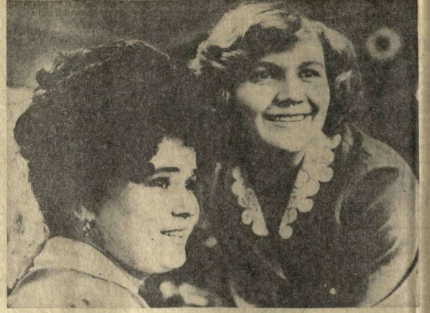
В работе они отличаются добросовестностью, высокой культурой обслуживания покупателей.