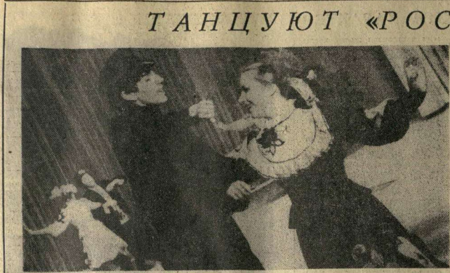
ХОРЕОГРАФИЧЕСКИЙ АНСАМБЛЬ ДВОРЦА КУЛЬТУРЫ ИМЕНИ ЛЕНИНА.