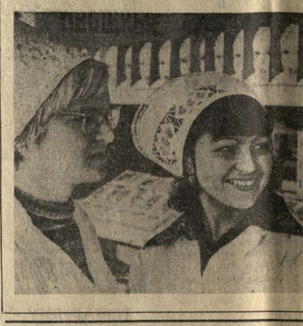
• Книжная полка атеиста