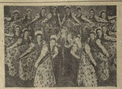
«Ярослава» — популярный народный ансамбль танца — неоднократный лауреат фестивалей самодеятельного художественного творчества. Недавно ансамбль подготовил красочную программу, с которой поздравит работников Советской железной дороги, сельских труженников Нернурской области. Девушки из Ярославля успешно гастролировали в Румынии, их искусство рупокасалась в Москве, Риге, Пецуре, Воротке. НА СНИМКЕ: фрагмент танца «Русская гармония».