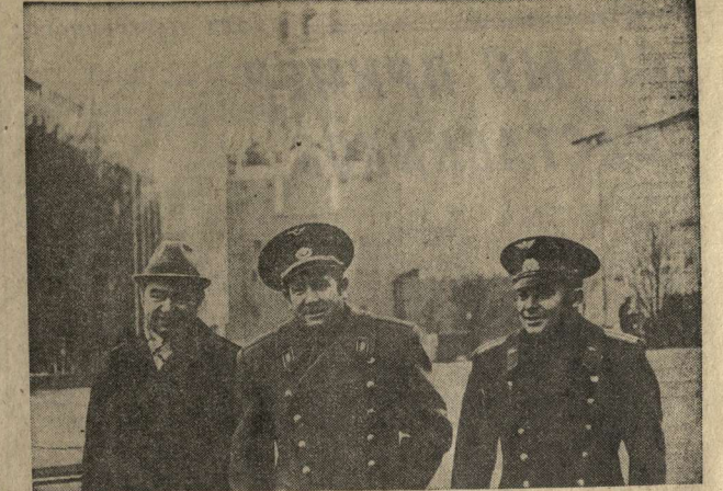
Экипаж космического корабля «Союз-26» Ю. В. Романенко (справа) и Г. М. Гречко (слева) с летчиком-космонавтом А. А. Леоновым на территории Космоса.

12 декабря в Кремле под председательством первого заместителя Председателя Президиума Верховного Совета В. В. Кузнецова состоялось заседание Президиума Верховного Совета СССР. В повестке дня — насущные вопросы жизни страны, связанные с осуществлением в действие новой Конституции СССР и совершенствованием советского законодательства, а рассмотрение на очередной сессии плана экономического и социального развития и Государственного бюджета, а деятельностью судебных органов СССР. Первый пункт повестки дня: о порядке организации работ ЦСР и проекта Закона о выборах в Верховный Совет СССР образованы комиссия Президиума Верховного Совета СССР. Президиум заслушал отчет о работе Верховного Суда СССР, с которым выступил председатель Верховного Суда Л. И. Смирнов. В отчете подробно освещена деятельность высше-