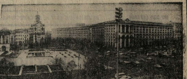
Киев. Поляны Октябрьской революции.