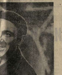
Товарищ Ф. Д. Кулаков