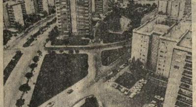
ИСПАНИЯ СЕГОДНЯ. НА СНИМКЕ: одна из площадей Мадрида.

В Комитетском районе проводится очередная устная агитационная работа по журналу для родителей.