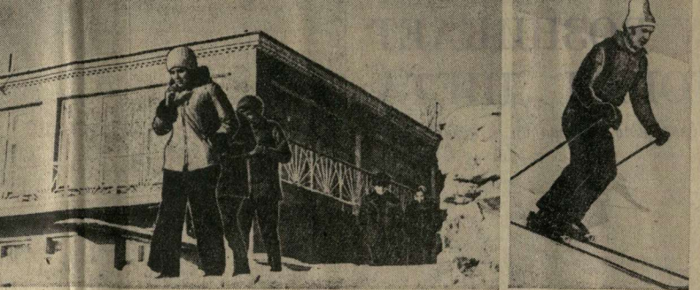
НА СНИМКАХ: У столовой башни (фото слева). На лыжах с крутой горы.

В зале областной филармонии, в театрах и дворцах культуры Воронежа почти каждый день проходят концерты известных музыкальных коллективов, популярных солистов — певцов, музыкантов, чтецов.