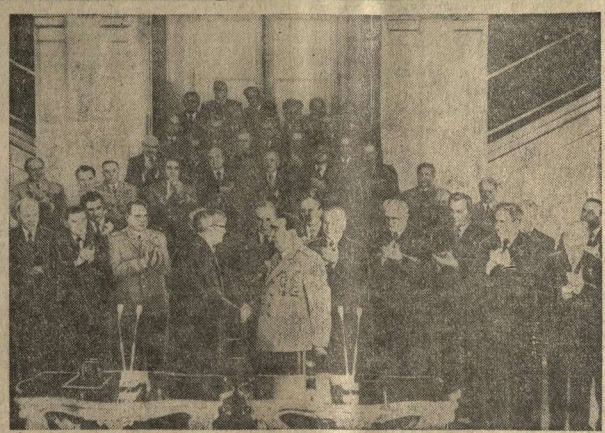
Москва. 20 февраля. Руководители Коммунистической партии и Советского государства при вручении награды товарищу Л. И. Брежневу. (Снимок принят по фототелеграфу). (ТАСС).