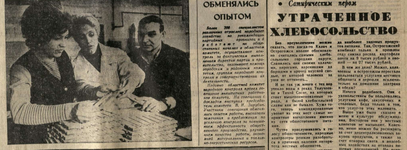
На контроле — товары массового спроса

В нашем районе 15 предприятий выпускают более 150 наименований товаров культурно-бытового назначения на сумму в 150 млн. рублей.