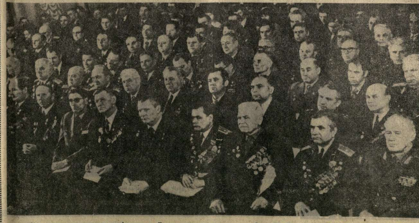
На снимке: президиум конференции. В зале заседания.