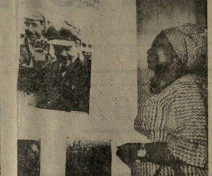
На снимке: лампа столыеры страны Ломы знакомится с советской пропангандой.