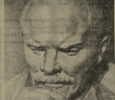
На снимке: скульптурный портрет В. И. Ленина, установленный в музее. Автор — А. Кибальников.