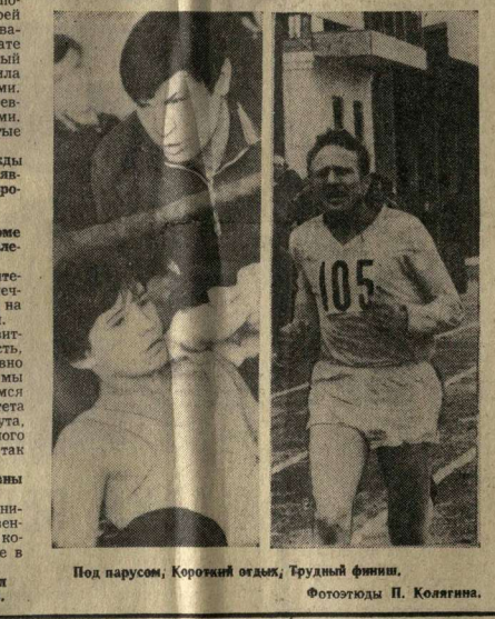
Под парусом, Короткий огдыль, Грудный финни.