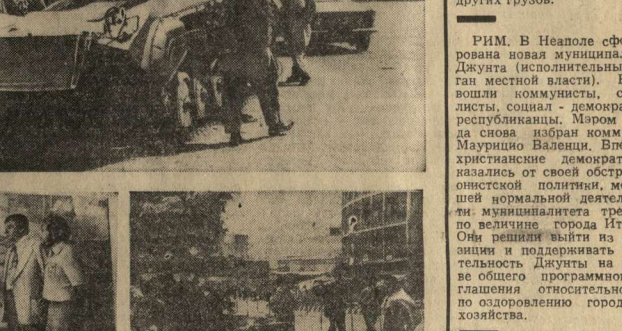
РИМ. В Неаполе сформирована новая муниципальная Дума (исполнительный орган местной власти). В нее вошли коммунисты, социалисты, социал-демократы и республиканцы. Мором города снова избран коммунист Маурисио Валенти. Впервые христианские демократы отказались от своей obstructive политики, мешавшей коммунистам в осуществлении муниципальной власти третьего по величине города Италии. Они решили выйти из оппозиции и поддерживать деятельность коммунистов на основе общепрограммного соглашения относительно мер по оздоровлению городского хозяйства.

ВАРШАВА. Со стальей судовой фирмы Паневской в Варшаву импортировано судно на верфи судно — гигант грузоподъемностью 116 тыс. тонн, оно построено по заказу Советского Союза. Новое судно грузоподъемностью 116 тысяч тонн, оно построено по заказу Советского Союза. Новое судно грузоподъемностью 116 тысяч тонн, оно построено по заказу Советского Союза.