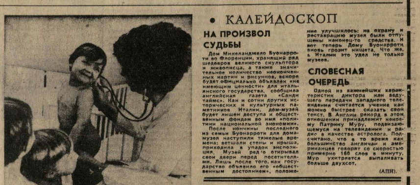
Подрастание поколение ГДР пользуется у государства большим вниманием.

В это время работники колхоза занимаются ремонтом механизированного участка производственного объединения. В это время работники колхоза занимаются ремонтом механизированного участка производственного объединения.