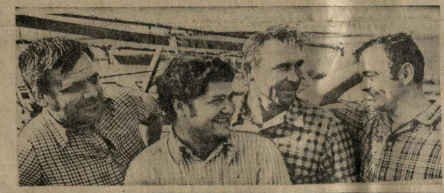
Участники XI Всемирного фестиваля молодежи и студентов.

Дорогие друзья! Сердечно приветствуя вас, участников XI Всемирного фестиваля молодежи и студентов, посланцев миллионов юных борцов за мир, безопасность и сотрудничество народов, за разоружение, национальную независимость, демократию и социальный прогресс. Участие в фестивале юной и девчачьей молодежи — это не только политический жест, это шаг к миру, к дружбе между народами. Участие в фестивале юной и девчачьей молодежи — это шаг к миру, к дружбе между народами. Участие в фестивале юной и девчачьей молодежи — это шаг к миру, к дружбе между народами.