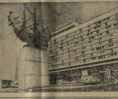
На снимках: сверху слева — с белорусских теплоходов, курсирующих по Неве, открывается панорама городского пейзажа...