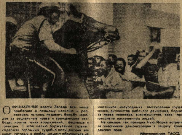
Митинг в Нью-Йорке в защиту гражданских прав.