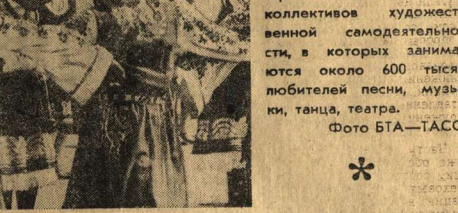
Танцует и поет молодость Болгарии. Сейчас в стране свыше 27 тысяч коллективов художественной самодеятельности, в которых занимаются около 600 тысяч любителей песни, музыки, танца, театра.

Второй этап наступления на Амазонию и Мату-Гросу, сопровождаемый наибольшей жестокостью, начался относительно недавно. Крупные плантации скрупулезно готовятся к возделыванию участка, расширяют их, сгоняя и уводя индейцев. Они нанесли баню головорезов, уничтоживших коренных жителей. Бандаги сбрасывают на индейские поселения с самолетов динамит, действуя по принципу: «Лучший индеец — это мертвый индеец».