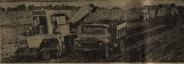
Механизаторам колхоза «Заветы Ильича» Нижнедевичьего района предстоит убрать 660 гектаров сахарной свеклы. Для этого здесь созданы механизированные звенья.