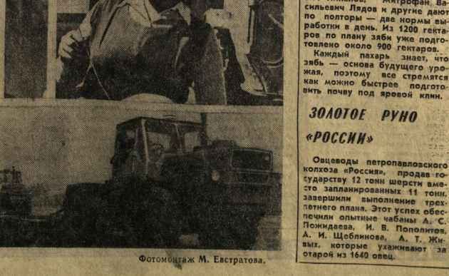
Фотоаппарат М. Евстратова.