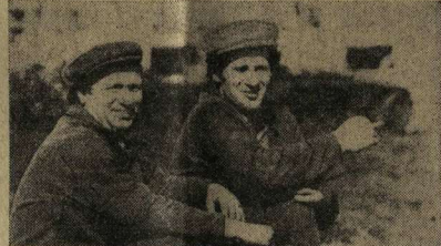
С ХОРОШИМИ РЕЗУЛЬТАТАМИ ВСТРЕТИЛИСЬ РАБОТНИКИ ОПЫТНО-ПРОИЗВОДСТВЕННОГО ТУРИЗМА ССР ТУРИЗМНИКА...