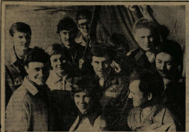
Славными делами отмечен трудовой семестр юного юбилейного года студенческим строительным отрядом ВГУ «Альтаир». Ребята выполнили большой объем работ на Всесоюзной ударной комсомольской стройке в г. Усть-Ижма на возведении аэропромышленного комплекса. Альтаиры выполнили план работ на 165 процентов, освоили 150 тысяч рублей. Хорошие результаты — хорошее настроение! НА СНИМКЕ: группа членов стройотряда «Альтаир».