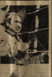
Еще в начале текущего года коллектив строителей № 2 воронежских организаций Минмонтажспецстроя СССР...