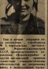
В последние дни бригады в смену здесь составляла 4,08 кубических метра, то сейчас уже достигли 5,5.