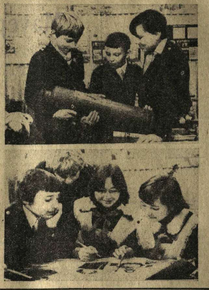
Э. ХОККЕР «Буря» начинает с победы

Часто в жилых домах по проспекту Грота, Московскому проспекту, по улицам Алексея Герасченко, Лидии Рябовой, Карпинского можно увидеть пионеров, внимательно осматривающих подвалы, чердаки. Это члены добровольной пожарной дру-