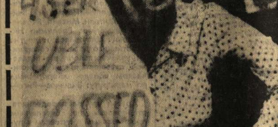
Австралийские пенсионеры требуют от власти права на обеспеченную старость.

ДЛЯ ОРОШЕНИЯ осваиваемых земель будут использованы воды большого алжирского водохранилища.