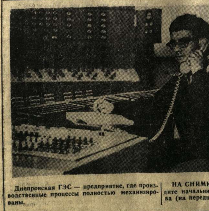
Днепровская ГЭС — предприятие, где производственные процессы полностью механизированы.

актива завода, состоящий из 212 агитаторов, 121 политинформатора, 115 лекторов, несет партийное слово в массы, словом и делом воспитывает и мобилизует на выполнение передовых задач. В 1978 году проведено 123 лекции и политинформации, в которых участвовало свыше 12 тысяч человек. В работе идеологического актива завода и цехов активно участвует комсомольское общество «Знание» прочитало циклический лекции на тему: «Ручной труд — на плечи машин». Большинство работников идеологического