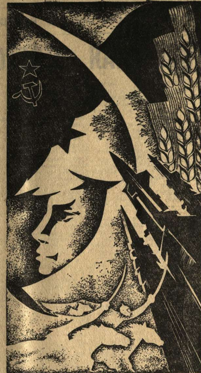
Рисунок художника А. Лоса.

Сегодня — День Советской Армии и Военно-Морского Флота