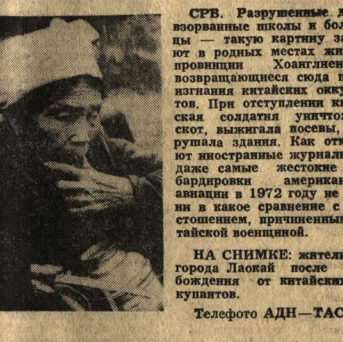
На снимке: жителями города Хэньгань после освобождения от китайских оккупантов.

После того как о чепельском проносе узнали в братских странах.