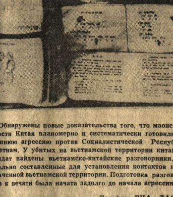
Обнаружены новые доказательства того, что маоистские власти Китая планомерно и систематически готовили вышедшую агрессивно против Социалистической Республики Вьетнам.

Корреспонденты АПН сообщают: «Заднескамеечники» английского парламента