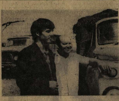
НЕПРЕРЫВНАЯ зеленая лента от доских лугов к животноводческим фермам движется сейчас в хохольском колхозе «Россия». Заманчиваешься сенокос, и пахучая трава или шумит и тут же пресс-подборщиком превращается в аккуратные тяжелые тюки, которые складываются возле МТФ, или отвозится к агрегату приготовления витаминной муки. В хозяйстве для полноценного зимнего питания животных решили заготовить 4000 центнеров витаминной муки, 3000 центнеров сена.

ПОЧЕМУ? ЧТО МЕШАЕТ ОРГАНИЗОВАННО ВЕСТИ РАБОТЫ?