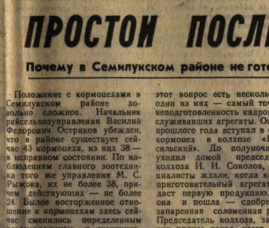
ПРОСТОЙ ПОСЛЕ... ПУСЬКА