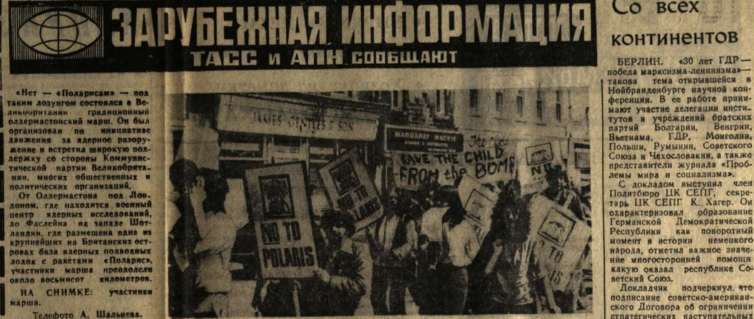
На снимке: участники марша.

Поиски библиофилов на полках автографа ДНАНДЫ на литературно-художественной полке