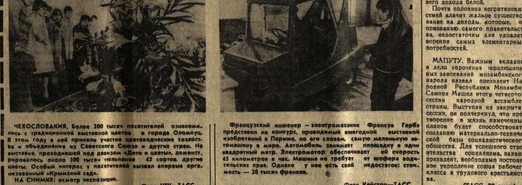
На снимке: осмотр экзипоним.